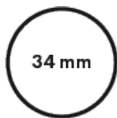
Diamètre du tube central 34mm